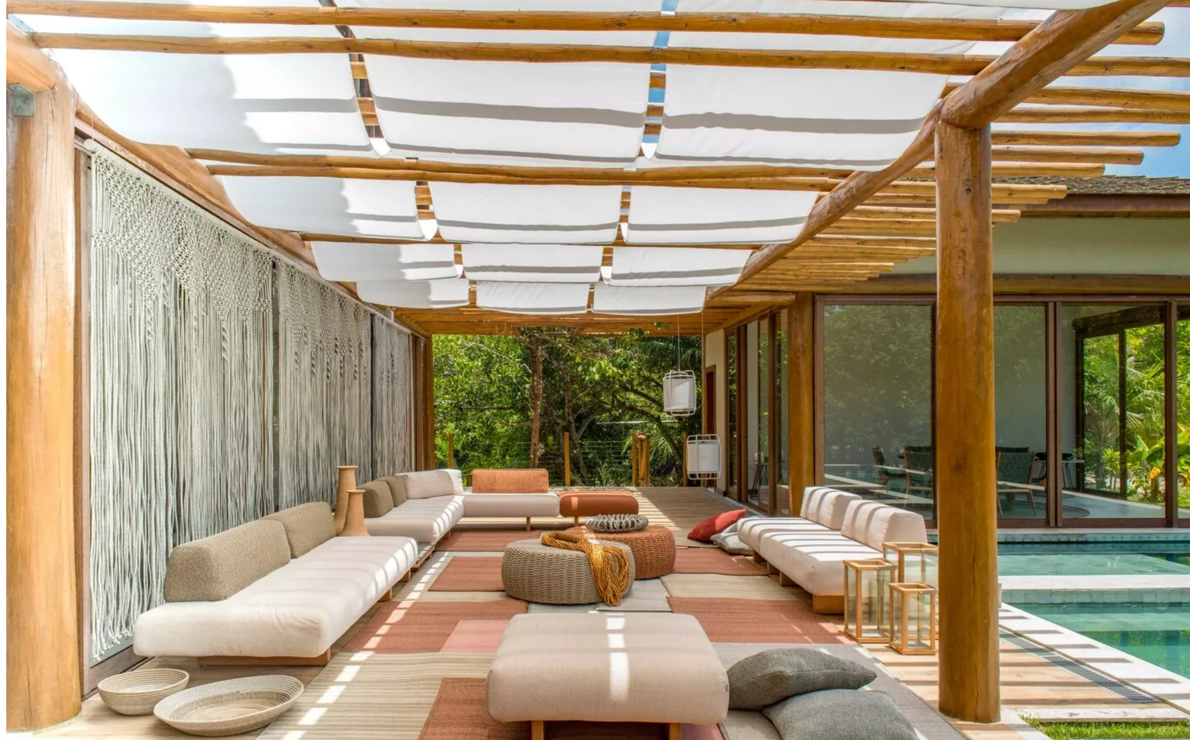
A LINHA PUCON, DESENVOLVIDA POR LUCIANO MANDELLI, FAZ REFERÊNCIA A PEQUENA E CHARMOSA CIDADE CHILENA DE MESMO NOME. O VILAREJO DE MONTANHAS ABRIGA CASAS COM ARQUITETURA CONTEMPORÂNEA E HOTÉIS BOUTIQUE