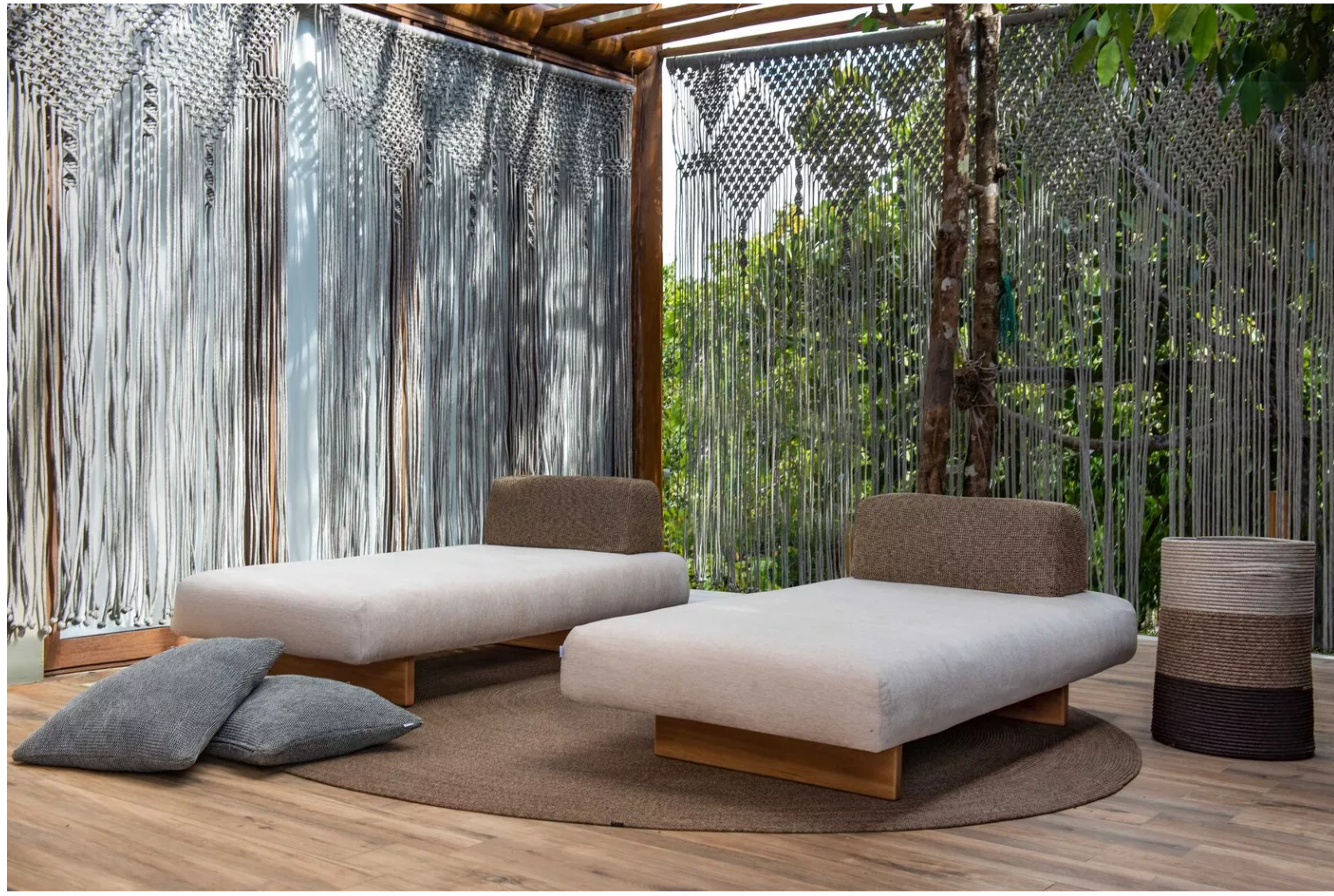
NOVA COLEÇÃO DE MOBILIÁRIO OUTDOOR TEM DESIGN INSPIRADO NA CULTURA LATINA

Ainda na Colômbia, onde nasceu, descobriu seu amor pela cor e pela forma, que até hoje são os elementos fundamentais de seu design. Reconhecido como o estilista fashionista de rock de Los Angeles com clientela de celebridades, sua estética pode ser definida como um diálogo contínuo entre designs contemporâneos inovadores e o artesanato atemporal do passado.