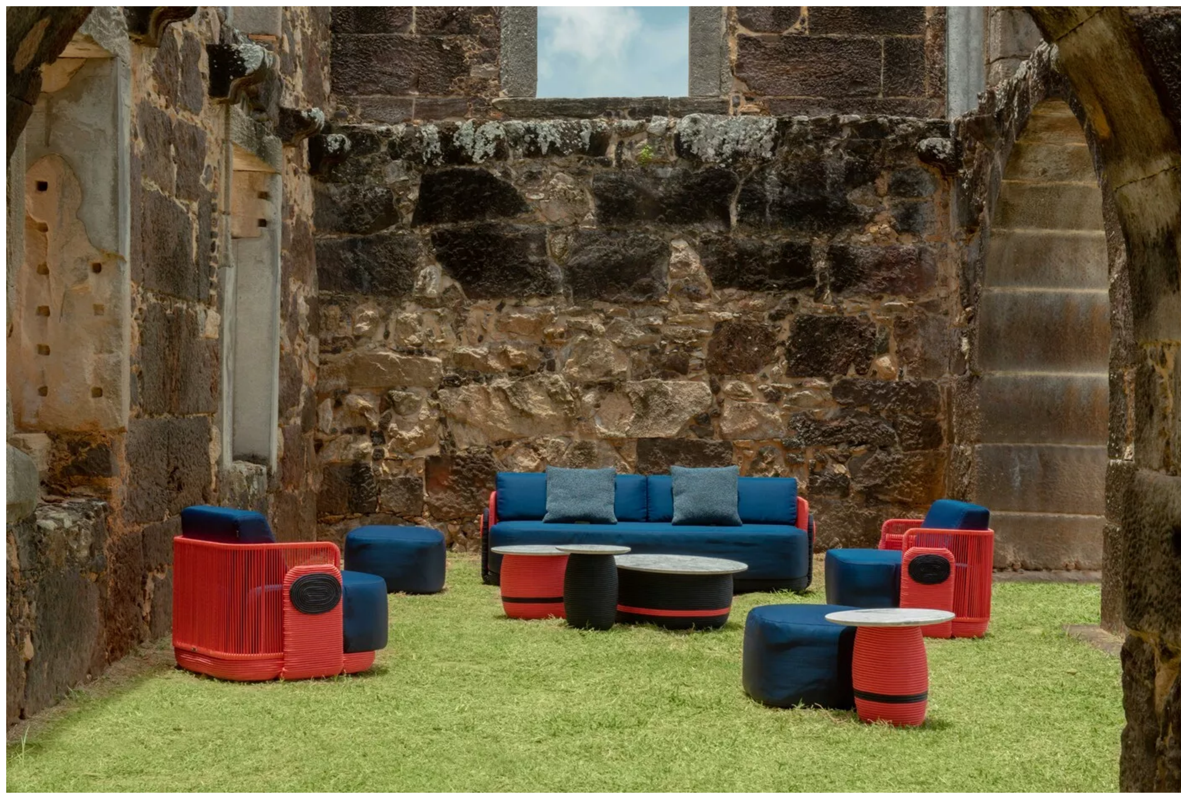
A LINHA MEDELLÍN, DE CÉSAR GIRALDO, REÚNE SOFÁ, POLTRONA E MESAS LATERAIS E DE CENTRO

Carregada de memória afetiva, cor e design, a linha Medellín, concebida por Giraldo, é uma das novidades. Nela, o designer resgata as lembranças e as cores de sua cidade natal como forma de apresentá-la ao mundo. Sofá, poltrona e mesas com formas arredondadas estão entre os lançamentos. "É sobre a Colômbia, sobre Medellín, cidade linda onde cresci com muito orgulho", exalta o profissional.